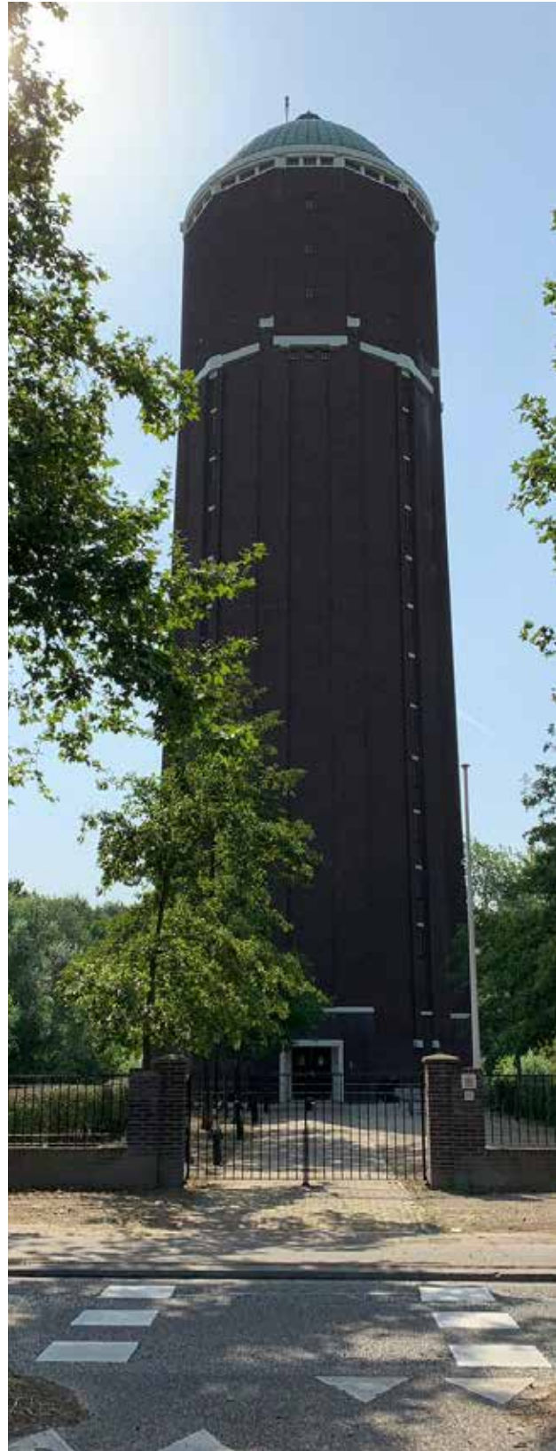
Op 40 meter hoogte in de toren staat een vat met water van 500 kuub.

De watertoren vormt, samen met het museum en de molen, het cluster het Warenhuis: www.hetwarenhuis.nl